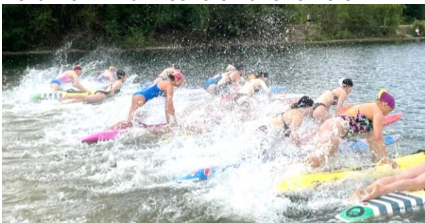
Start des Boardrace der AK 15/16w

Mit einem etwas kleineren Kader als in den Jahren zuvor machte sich die Rettungssportgruppe am 20. und 21.08.2022 auf den Weg nach Neuenkirchen zum Offlumer See , wo die dortige OG Neuenkirchen/Wettringen die Meisterschaften für die Landesverbände Nordrhein und Westfalen ausrichtete.